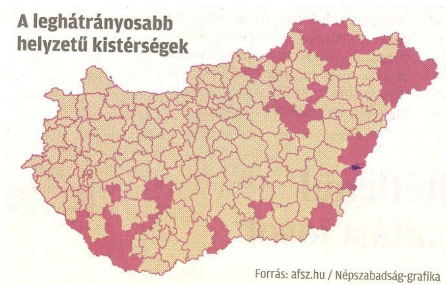
3. ábra: A leghátrányosabb helyzetű kistérségek Magyarországon

A bajok megállapítása mindig a segítségnyújtás első lépése. A különböző gazdasági mutatók alapján 2002-ben megállapított diagnózis súlyos, de fájóan reális. A gazdasági elemzés Zsadányt a 42 leghátrányosabb helyzetű kistérségek körébe sorolta.