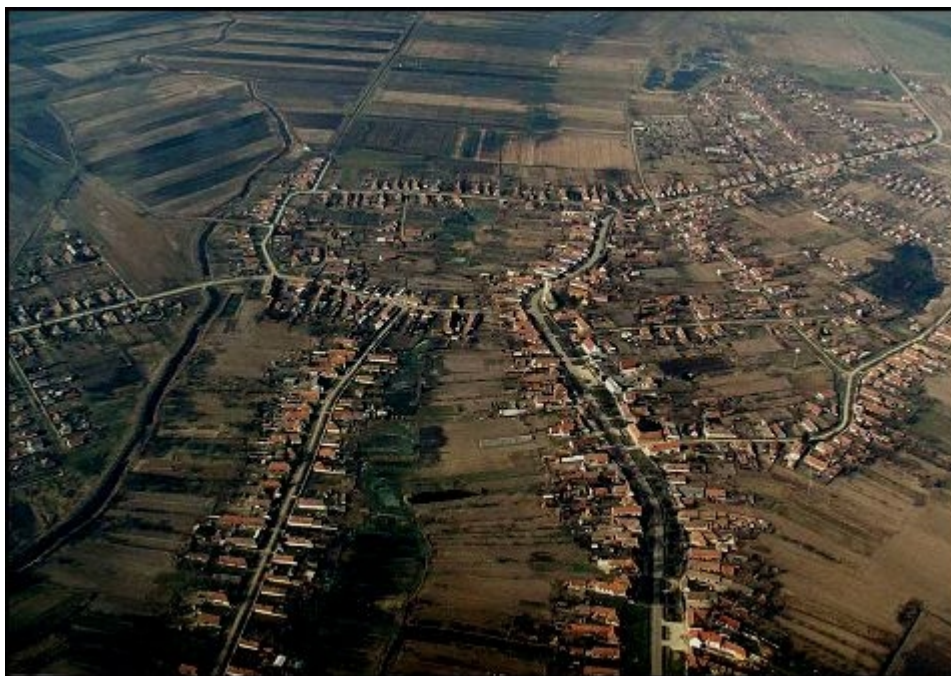
2. ábra: Légifelvétel a községről

A mai településről az első említés az istenítéletekről készített Váradi Regestrumban található, 1219-ből. IV. Béla korában „Korhan-Stagnum Körös-Sadan”-ként szerepelt. Viszontagságos törté-